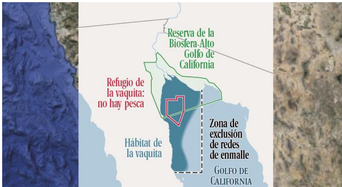
Figura 2: Hábitat de la vaquita marina 9 .

En este punto tal vez la pregunta sea: en qué afecta todo esto a la vaquita marina. Este animal marino comparte hábitat y unas dimensiones parecidas con la totoaba. La especie denominada Phocoena sinus es un cetáceo endémico de la zona norte del mar de Cortés. Aunque no tiene valor alguno para los pescadores furtivos, las técnicas pesqueras utilizadas por estos, entre ellas el uso de redes agalleras, contribuyen a que el cetáceo quede atrapado en las redes y como consecuencia de ello muera. Según estimaciones recientes, los ejemplares de vaquita marina que quedan serían menos de treinta, por lo cual la especie ya ha sido catalogada como especie en inminente riesgo de extinción.