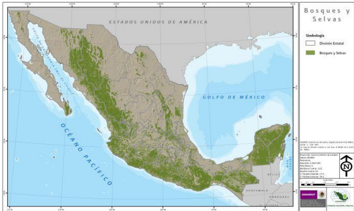
Figura 3: Distribución de los bosques y selvas en México (2004-2009) 15 .

cifra entre los 52 mil millones y los 157 mil millones de dólares las ganancias que reporta esta actividad 13 . La tala ilegal supone una gran oportunidad para los grupos criminales, sabedores de que países superpoblados como China o India demandan grandes cantidades de madera, más de la que sus propios territorios pueden ofrecer 14 .