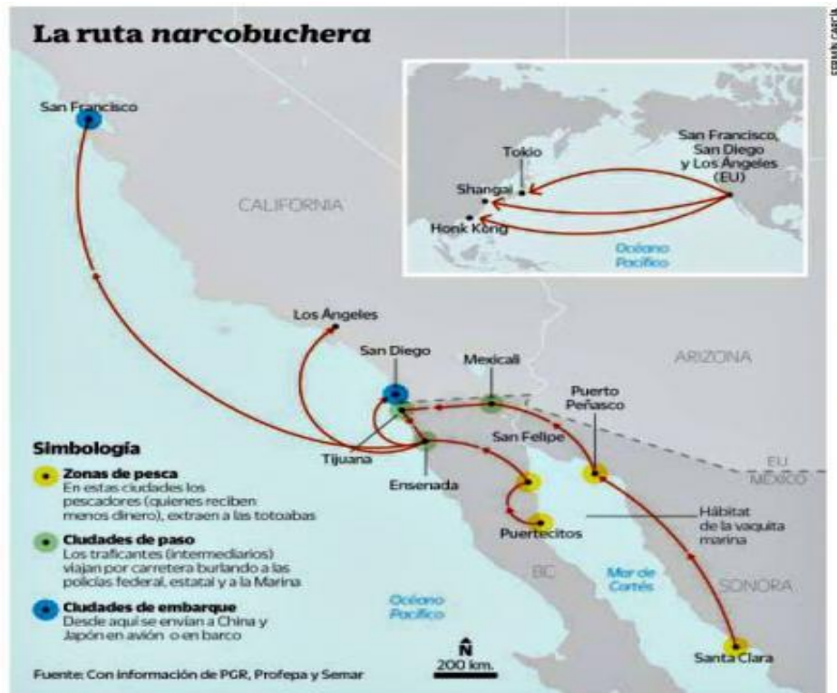
Figura 1. Rutas de la pesca furtiva 6

Una vez que ya tienen el producto en su poder, este es transportado hacia las denominadas «ciudades de embarque», que pueden ser Tijuana o Ciudad de México, o ciudades estadounidenses como San Diego, Los Ángeles o San Francisco. Esas ciudades de paso son clave en el proceso, ya que cuentan con buenas conexiones por avión con destinos nacionales e internacionales, además de que en ellas se deciden cuestiones como la forma en que se vende el producto, fresco o congelado y que dinero recibe cada parte implicada 7 . Normalmente, las negociaciones se establecen entre miembros del crimen organizado y ciudadanos chinos asentados en México, con conexiones en su país y otros países asiáticos. El último paso del proceso es el envío de la mercancía a Asia, por barco y avión, incluso muchas veces usando servicios de mensajería. Los destinos preferentes son puertos de Vietnam, Taiwán y Hong Kong en China 8 . Al igual que pasa en otros casos de tráfico ilegal de algún producto, este se