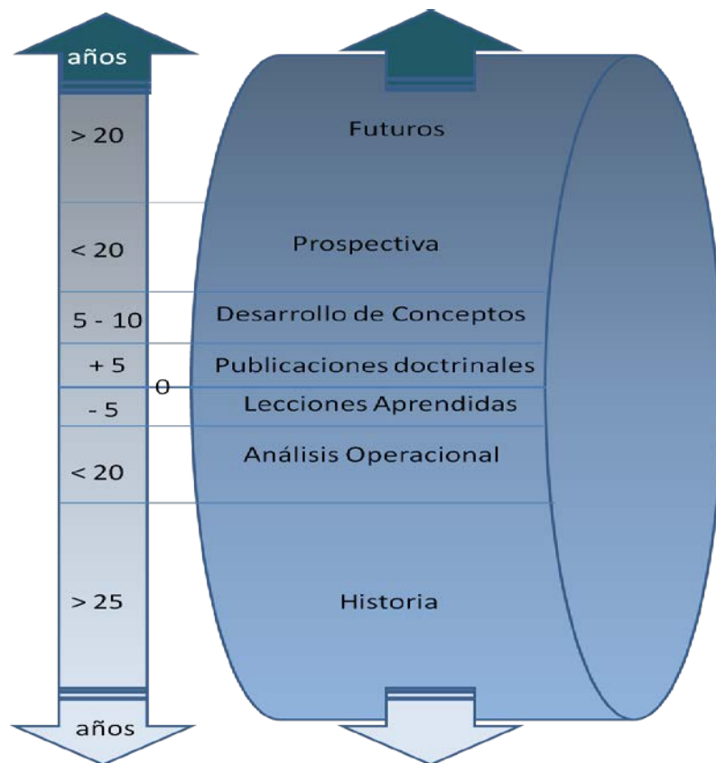
Figura 3: El tiempo y la doctrina.

el desarrollo de doctrina se produce gracias a las aportaciones de procesos de análisis histórico (antiguo) y operacional (reciente), de lecciones aprendidas (contemporáneo), desarrollo de conceptos (corto y medio plazo), prospectiva (largo plazo) y futuros (más allá). Según este esquema, la doctrina se concreta en publicaciones a las que se les fía un periodo de vigencia en el corto plazo, tiempo máximo en el que el proceso permanente de revisión crítica debe dar a luz una versión renovada con las aportaciones de todos los procesos.