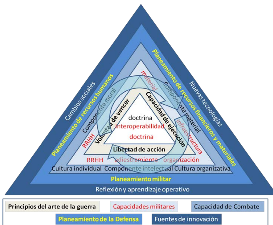
Figura 4: Triángulo de la transformación militar.

producir innovación orientada a satisfacer las necesidades de empleo de las Fuerzas Armadas en pos de los objetivos de la defensa nacional.