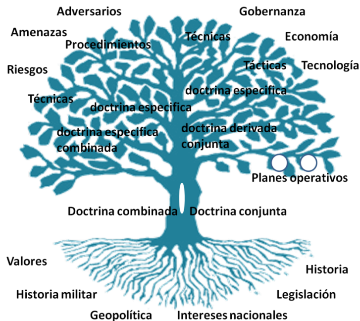
Figura 2: Árbol doctrinal.

Cuando unas Fuerzas Armadas tienen previsto el empleo de distintos triángulos básicos de capacidades (nacionales o aliados) que suponen diferentes marcos doctrinales de actuación, el árbol doctrinal se torna en semiarbusto que consta de varios troncos y de ramas y raíces tanto exclusivas como compartidas.