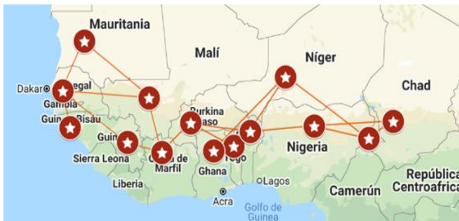
Figura 2. Mapa de países de origen y destino de niños en escuelas coránicas y movimientos transnacionales.

El alejamiento de los niños del hogar y la sociedad, el analfabetismo y el hecho de que sólo memoricen el Corán, proporciona a ideólogos extremistas la apertura cognitiva necesaria para facilitar el reclutamiento y radicalización.