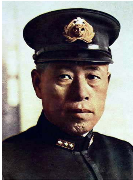
Figura 3. Almirante Isoroku Yamamoto (1943). Fuente: War History online. Disponible en: https://www.warhistoryonline.com/world-war-ii/yamamoto-footage-operation-vengeance.html

Yamamoto era un héroe nacional y miles de japoneses asistieron en Tokio a su funeral. La inteligencia estadounidense estimó que su muerte sería un duro golpe para la moral y la estrategia militar japonesas en el Pacífico, factores que se sopesaron con la posibilidad de que el enemigo supiese que sus códigos eran conocidos; y se decidió al más alto nivel, el presidencial, que merecía la pena correr el riesgo 28 .