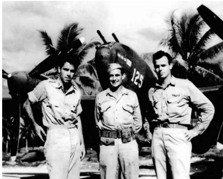
Figura 2. Los supervivientes del Killer Flight en el aeródromo de Guadalcanal después de la misión.

El almirante japonés era un oficial al mando en operaciones y, por lo tanto, un objetivo legítimo. Por ello, tanto el nombre elegido para la misión, Operación Venganza, como el nombre en clave de Yamamoto, Dillinger 24 , responderían más a cuestiones mediáticas y de refuerzo de la moral que a las motivaciones reales de la operación 25 . Hoy en día, no cabe duda de que derribar a Yamamoto fue un acto de guerra lícito.