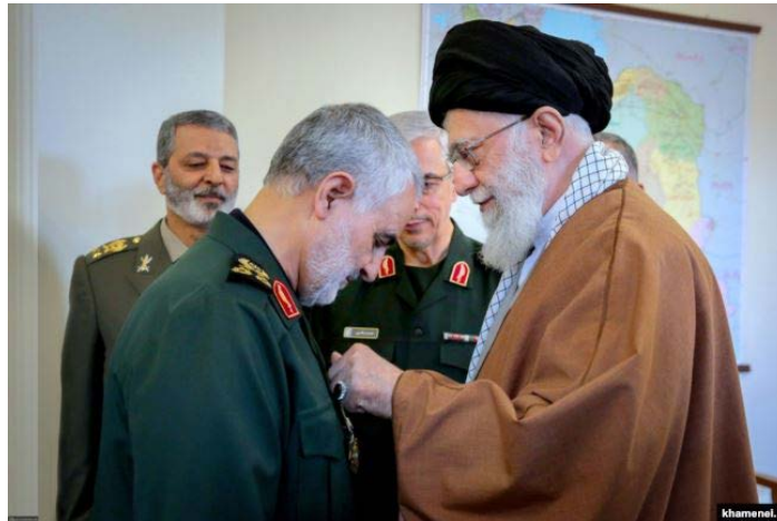
Figura 4. El líder supremo Khamenei condecora al general Soleimani en verano de 2019.

En las primeras horas de la mañana del pasado viernes 3 de enero, el vehículo en el que viaja el general Qassem Soleimani salta en pedazos tras ser alcanzado por dos misiles Hellfire R9X Ninja 29 en las proximidades del aeropuerto internacional de Bagdad. El general iraní al mando de la Fuerza Quds muere instantáneamente en lo que ha sido una operación TK de manual 30 .