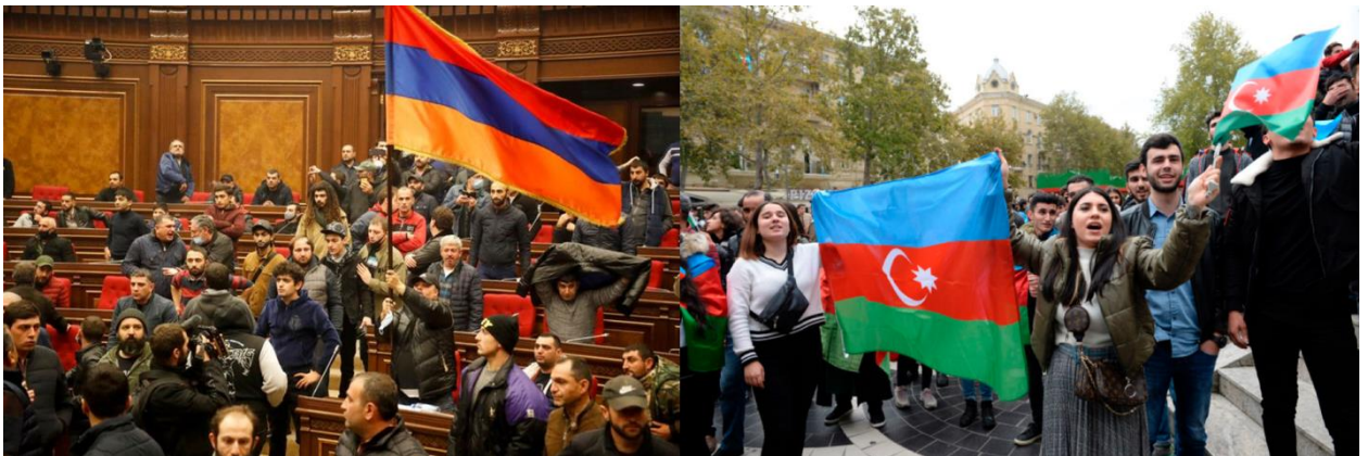
Figura 4. Izda: Revuelta de ciudadanos armenios protestando en el Parlamento. Dcha.: Celebración de los azerbaiyanos en las calles de Bakú.

La firma de este acuerdo ha repercutido directamente en la vida diaria de los ciudadanos de ambos países, ocasionando dos escenarios claramente diferenciados. Los habitantes de Azerbaiyán están organizando celebraciones multitudinarias con motivo de la recuperación de los territorios perdidos en 1994. Sin embargo, la sociedad armenia ha resultado duramente damnificada y las discrepancias entre la población no han tardado en surgir. En Ereván, se han producido grandes revueltas en contra del primer ministro reclamando su dimisión. Por su parte, Nikol Pashinyan, ha creado un plan de acción 30 compuesto por 15 puntos basados principalmente en el regreso de los ciudadanos a Artsaj, y en programas de rehabilitación económica y moral. Por otro lado, la mayoría de los armenios obligados a abandonar sus hogares en las regiones colindantes a Nagorno Karabaj, han decidido incendiar sus propias viviendas para evitar que los azerbaiyanos saquen provecho de sus pertenencias.