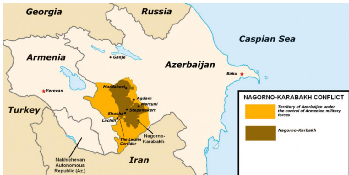
Figura 1. Mapa de Nagorno Karabaj antes de la reanudación del conflicto armado en septiembre

La escalada en las hostilidades entre Armenia y Azerbaiyán, a lo largo de los últimos meses, evidenciaba, desde un principio, que el estallido de una nueva fase abierta del conflicto era cuestión de tiempo. Ambos países, históricamente enfrentados por el control de la región de Nagorno Karabaj 1 , han vivido los últimos 26 años en una tensa atmósfera, predominada por negociaciones fallidas, falta de predisposición política y enfrentamientos armados puntuales. Antes de la reanudación del conflicto, dicho enclave, pese a estar ubicado íntegramente dentro de territorio azerbaiyano, se encontraba poblado por un 99,7 % de armenios, los cuales vivían bajo el control directo de la autoproclamada República de Artsaj 2 .