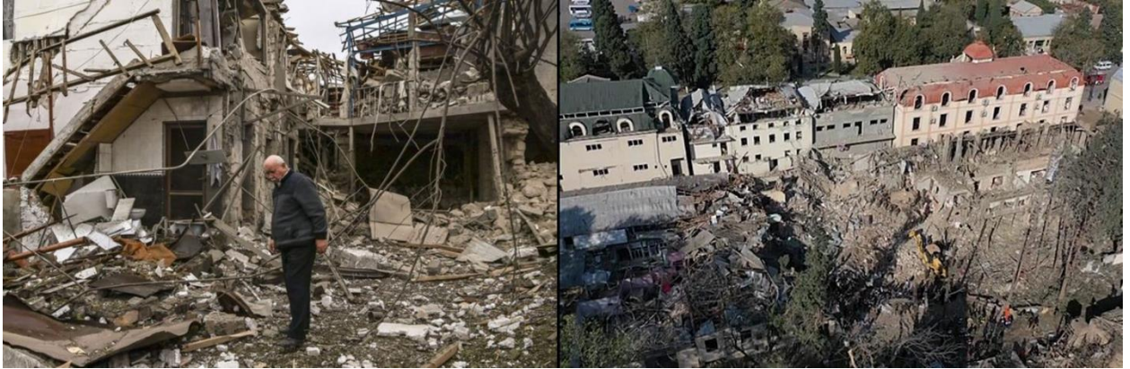
Figura 3. Izda: Un anciano observando los destrozos producidos por un bombardeo en Stepanakert. Dcha: Escombros de un edificio residencial tras la colisión de un misil en Ganyá.