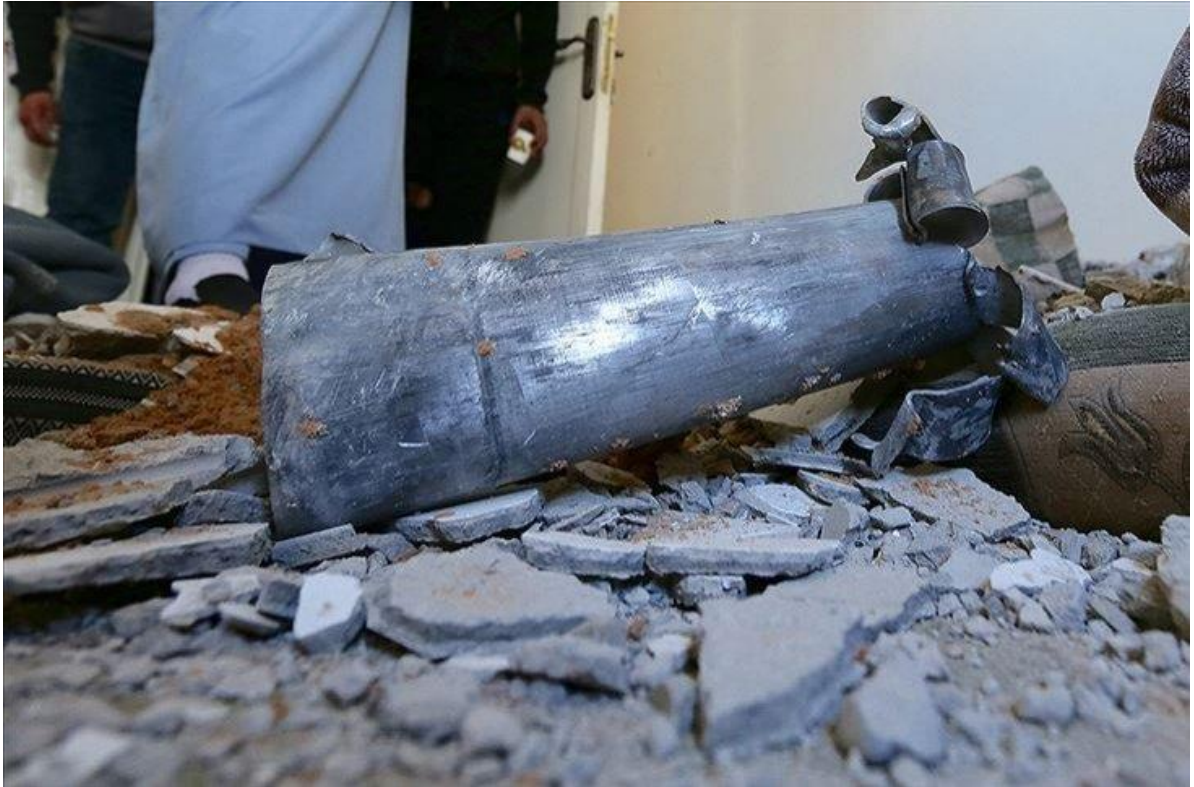
Figura 5. Restos de un misil tras su colisión en una vivienda iraní.

También instó a Armenia y Azerbaiyán a poner fin al conflicto por motivos de seguridad ya que temía verse perjudicado por la existencia de un conflicto armado en la región, de hecho se vio afectado por la colisión de cohetes y misiles en su territorio. A principios de octubre, 8 proyectiles obligaron a más de una docena de residentes a abandonar su vivienda y un niño resultó herido. A mediados del mismo mes, cayeron al menos 10 misiles en la provincia iraní de Azerbaiyán Oriental, dañando a un civil tras la colisión de un misil en su domicilio 34 .