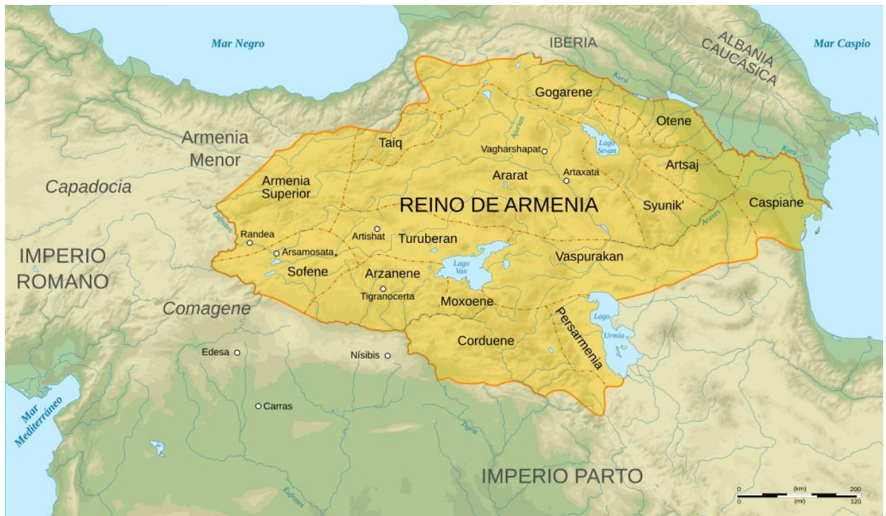
Figura 2. Mapa de Nagorno Karabaj (Artsaj) bajo la influencia del Reino de Armenia.