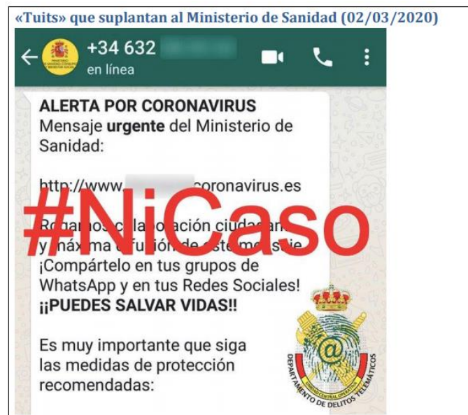
Figura 7. Ejemplo de bulo.