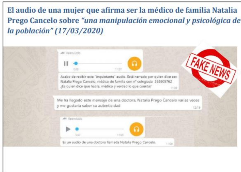
Figura 5. Audio de una mujer. Fuente. Informe CITCO y Ministerio de Interior.

Evidencias de intentos de desestabilización del Gobierno 37 :