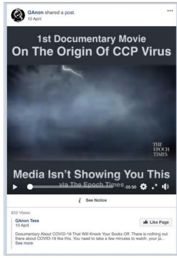
Figura 3. Cuenta de Facebook de QAnon.

En lo relativo a Twitter, un informe de NewsGuard 31 también hizo un seguimiento sobre los «superdifusores» de información errónea en la plataforma digital de Twitter. Estos presentan cuentas de esta red social que repiten, comparten y amplifican bulos sobre la COVID-19. En este caso específico, para que NewsGuard pudiera calificar de «superdifusores» a las siguientes cuentas de Twitter, debía contar con tres requisitos esenciales: a) tener seguidores de más de 100 000 seguidores en Twitter; b) haber publicado o compartido contenido clara y notoriamente falso sobre el virus; y c) estar activos a partir del 5 de mayo de 2020, es decir, que Twitter no hubiese tomado acción para eliminarlos antes de que NewsGuard actuase.