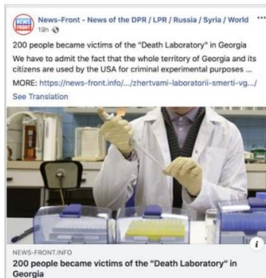
Figura 2. Ejemplo de noticias inauténtica.

Hay investigaciones sobre la sospecha de comportamientos inauténticos coordinados ligados a actividades dirigidas a la población en Rusia y en la región de Donbass, y dos organizaciones de medios de comunicación en Crimea — NewsFront y SouthFront —. Véase la imagen 29 :