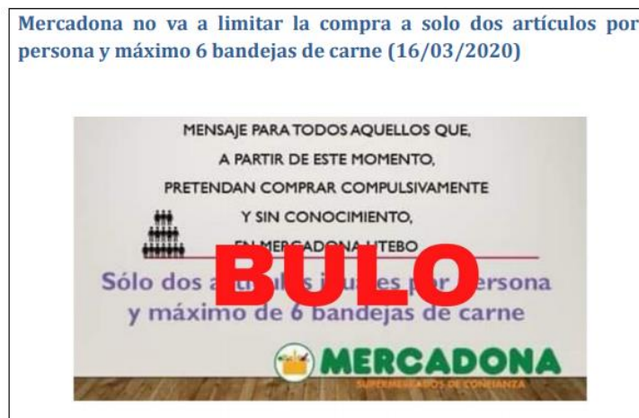
Figura 4. Ejemplo de bulo.

Evidencias de generación de pánico social 36 :