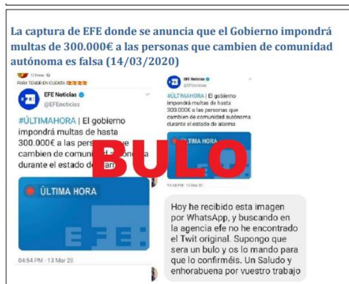
Figura 6. Ejemplo de bulo. Fuente. Informe CITCO y Ministerio de Interior.

Evidencias de intentos de desestabilización del Gobierno 37 :