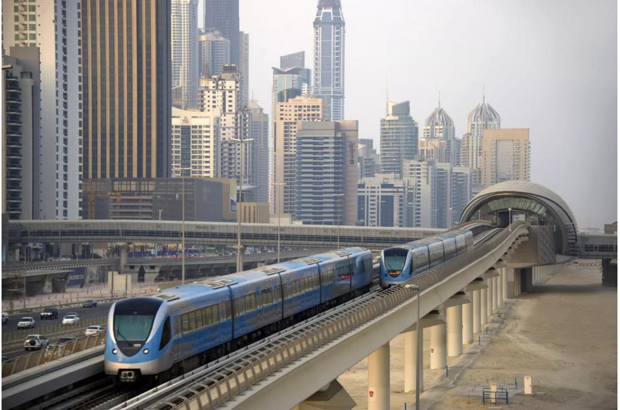
Figura 3. Infraestructura ferroviaria en Dubai.