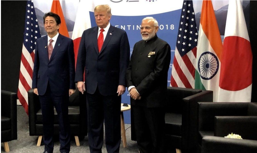
Figura 2. Abe, Trump y Modi en el G-20.

Tanto Japón como India y Australia consideran como un elemento básico el respeto a la libertad de navegación y al derecho internacional. Especialmente importante es para Japón la apertura de las líneas marítimas de comunicación para su economía y, por ello, durante la conferencia de Shangri-La del año 2014, Abe abogó por el establecimiento de los tres principios del Estado de derecho en el mar: