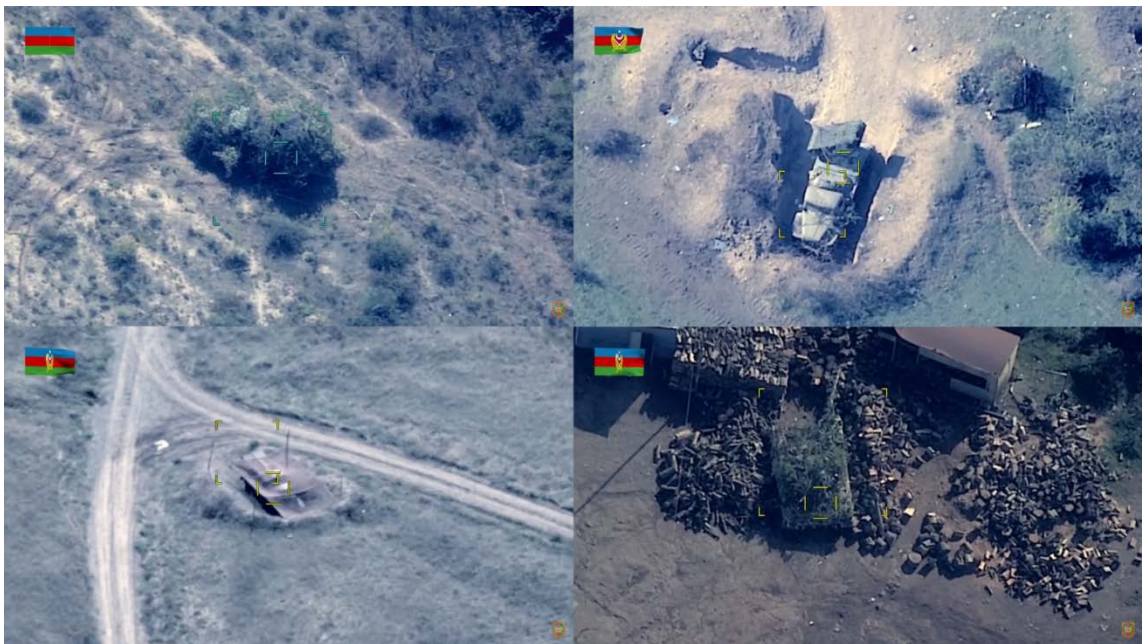
Figura 5. Varios tipos de camuflaje y ocultación de las Fuerzas armenias.

Evitar la detección por medio de camuflajes es extremadamente complejo, ya que eliminar totalmente la huella visual y térmica es prácticamente inviable. A su vez debe ser aplicado tanto en condiciones diurnas como nocturnas, debido a la capacidad de operación nocturna de los drones. Por ello debe ir acompañado de otras medidas de defensa pasiva como la dispersión, «bunkerización», ocultación o la decepción como el uso de señuelos 34 . A su vez las tropas deben estar instruidas y concienciadas.