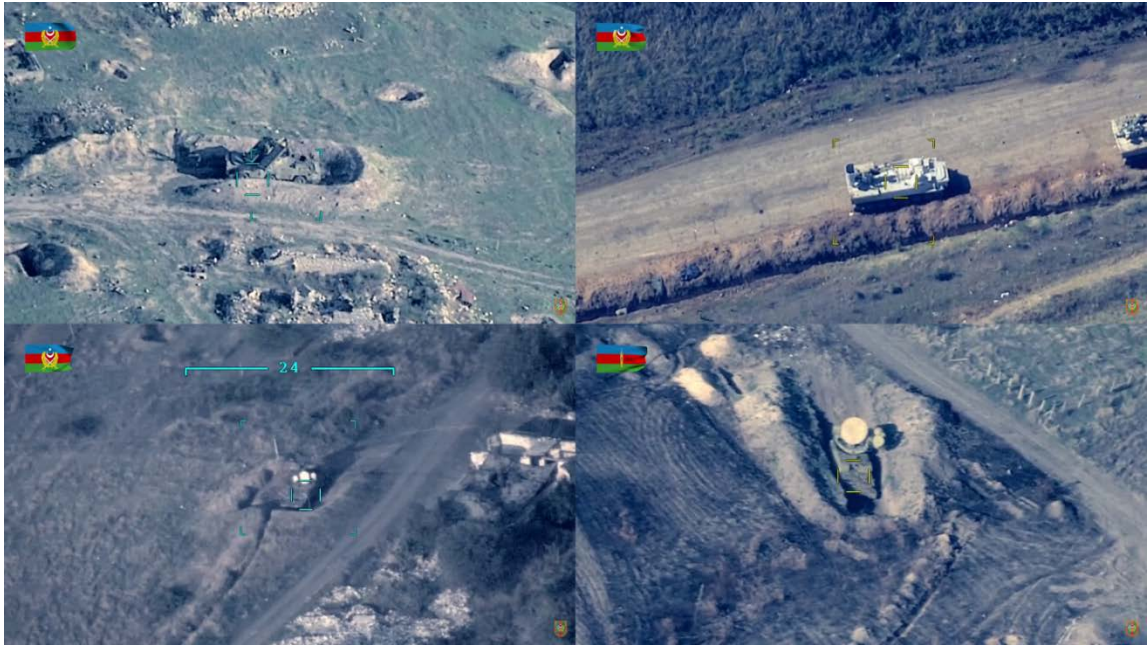
Figura 3. Dron TB-2 azerí abatiendo sistemas antiaéreos armenios. Fuente. Ministerio de Defensa de Azerbaiyán. Disponible en: https://www.youtube.com/watch?v=WGpOg93GPKg y https://www.youtube.com/watch?v=bNoPM5T6qoE