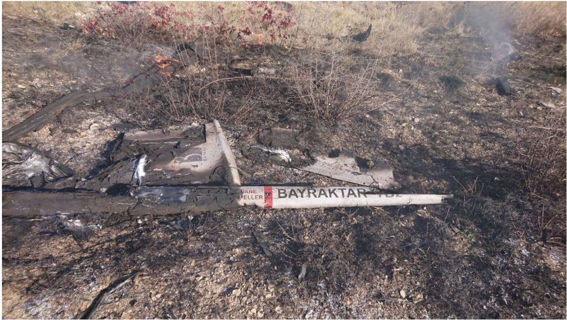
Figura 2. Restos de un dron TB-2 azerí derribado por las fuerzas de Defensa Aérea armenias.