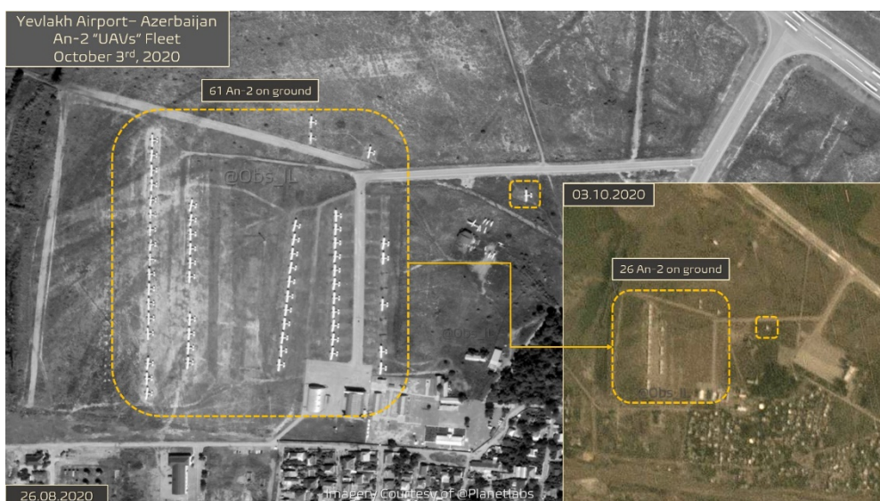
Figura 4. Aeropuerto de Yevlakh (Azerbaiján) con 61 An-2 en plataforma.

En general, la combinación de drones en misiones ISTAR, drones de combate TB-2 armados con misiles MIM y munición merodeadora específica para misiones SEAD se ha demostrado extremadamente eficiente frente a las defensas armenias, con la aplicación de tácticas y estrategias específicas para cada tipo de sistemas de armas antiaéreo acometido.