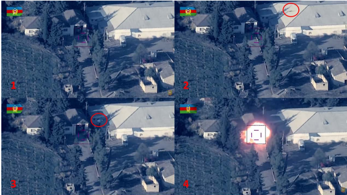
Fuente 6. Secuencia de ataque a un SA-15 con munición merodeadora. Fuente. Ministerio de Defensa de Azerbaiyán. Disponible en: https://www.youtube.com/watch?v=C0pcbeSm0Sw