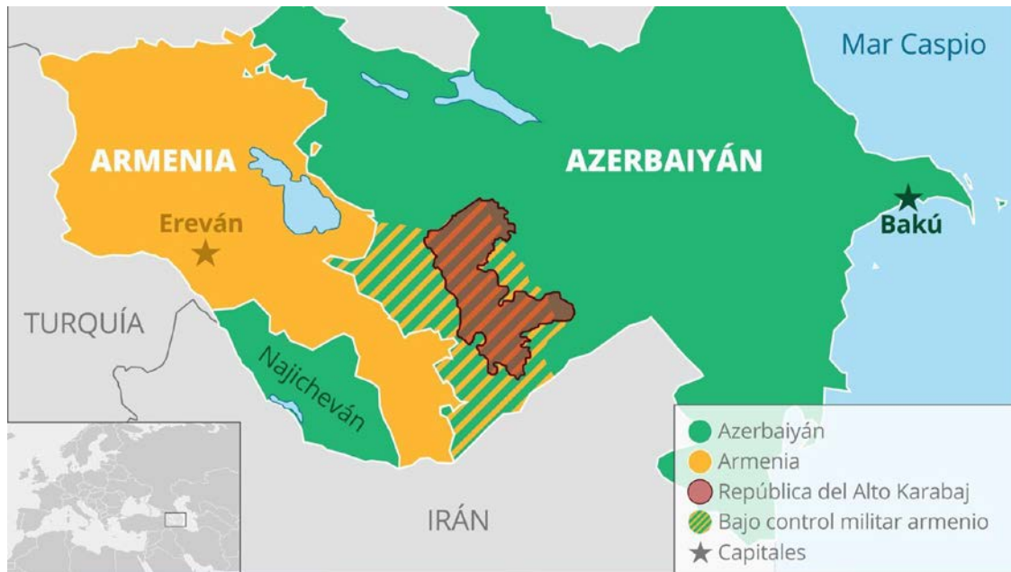
Figura 1. Mapa de situación con anterioridad al conflicto.

El domingo 27 de septiembre de 2020 se retomaron las hostilidades en la línea de contacto de la región de Nagorno Karabaj, entre las Repúblicas de Armenia y de Azerbaiyán. Este enclave, fruto de la desintegración de la Unión Soviética y de su otrora conocida como oblast 1 autónoma del Alto Karabaj, ha sido fuente de numerosos enfrentamientos entre ambos países.