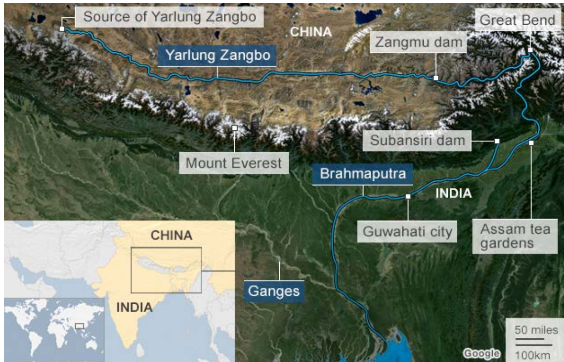
Figura 4. Gran Curva del río.

electricidad al sudeste asiático y unir a éste la economía de Tíbet y otras provincias (Sichuan, Yunnan...) 43 .