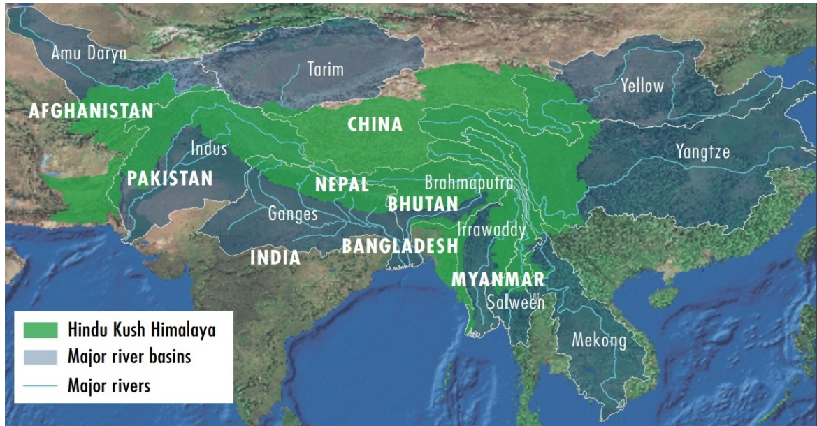
Figura 1. Cuenca del Hindu Kush Himalaya.

La cuenca del Hindu Kush Himalaya (HKH) es la generadora fundamental de agua dulce en Asia 1 . Esta «torre de agua» concentra unos 54 000 glaciares, marca los patrones regionales de precipitación y afecta a los monzones, creando una «sombra de lluvia» entre el norte y el sur de la cordillera 2 .