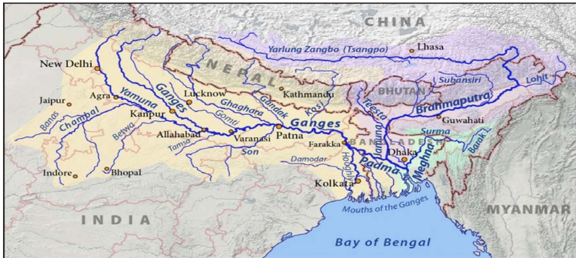
Figura 2. Río Brahmaputra/Yarlung Tsanpo.

El Brahmaputra (Yarlung Tsangpo/Zangbo en tibetano/chino), posee unos 2896 km de longitud. Nacido en el glaciar Chemayungdung, el Dyardanes helénico discurre casi 1100 km como Tsangpo (purificador) por la región autónoma de Tíbet (China) hasta alcanzar el Namjagbarwa donde gira en la Gran Curva hacia el suroeste penetrando en India por AP. Desde aquí hasta Assam se conoce como Siang, cabecera principal en India que aporta entre el 20-30 % del caudal. Llamado Jamuna en Bangladés recibe al afluente Teesta antes de unirse al Ganges que junto al Meghna, forman el delta Ganges-Brahmaputra en el golfo de Bengala 35 .