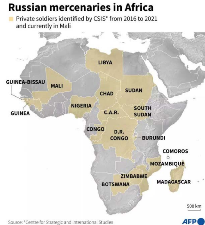
Figura 2. Presencia de mercenarios rusos en África para 2021. Fuente. CSIS en France 24. “Private military contractors bolster Russian influence in Africa”, 4 de febrero de 2022. Disponible en:

https://www.france24.com/en/live-news/20220204-private-military-contractors-bolster-russian-influence-in-africa