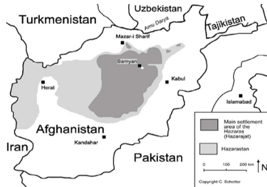
El Hazarayát (mayoría hazara) y el Hazarastán (presencia hazara)

declaraciones se basan en una fatua del fundador de los talibán, Mulá Omar: «No hay diferencia entre herejes y chiitas y es una obligación luchar contra ellos».