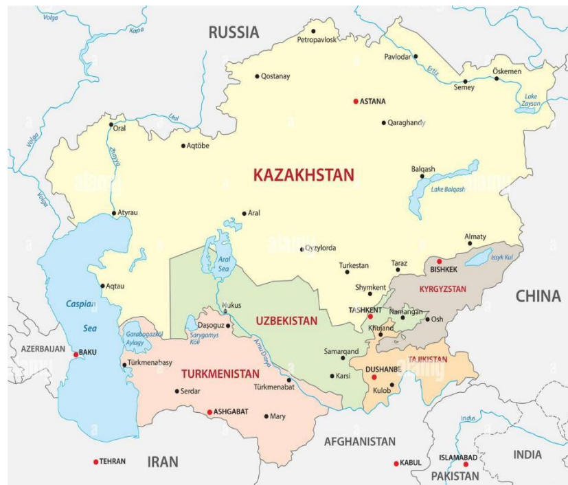
Figura 1. Mapa de Asia Central

Asia Central, formada por Kazajistán, Uzbekistán, Turkmenistán, Kirguistán y Tayikistán, no es una región plenamente integrada ni política ni económicamente. Debido a la singularidad y a las particulares señas de identidad de cada una de estas naciones, con la desaparición de la URSS afloraron controversias entre ellas 1 . En general, los países centroasiáticos son reacios a depender perennemente de Rusia, cuyas prioridades se resumen en tres: 1) ser el socio económico, geopolítico y de seguridad prioritario, 2) mantener un «ambiente cultural compartido» y 3) minimizar la influencia externa que rivalice con ella.