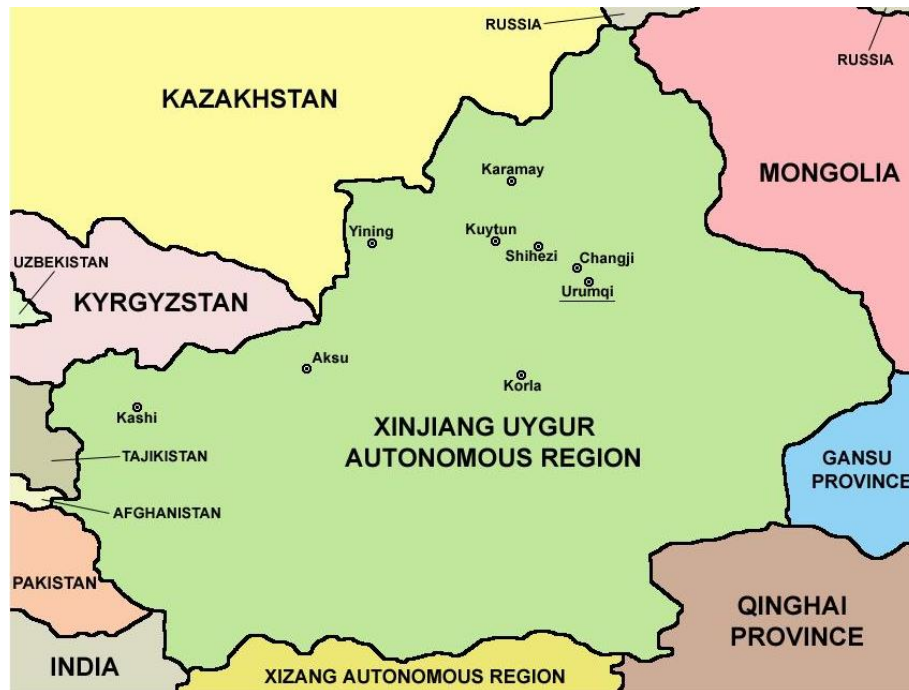
Figura 3. Región autónoma de Xinjiang (China)

Así pues, la OCS representa para China un mecanismo que facilita una base legal para aplicar leyes transfronterizas contra el terrorismo 31 .