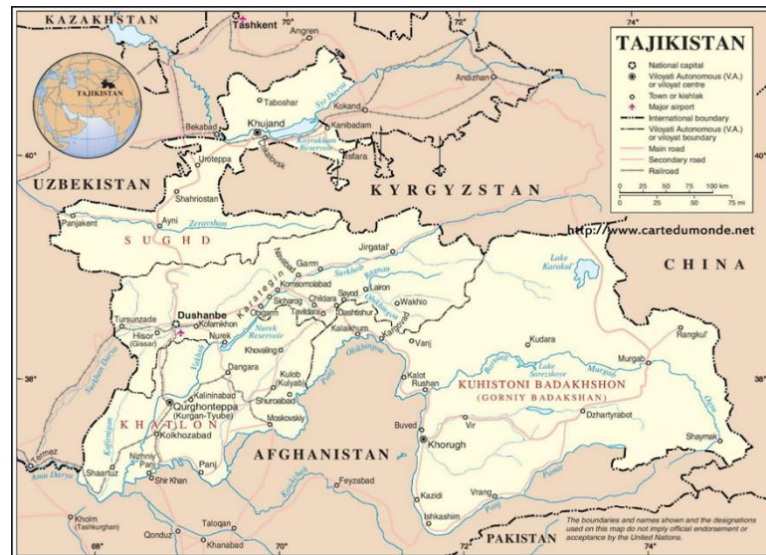
Figura 4. Mapa de Tayikistán

Elemento estratégico para la seguridad nacional de China, su frontera afgana, permeable al terrorismo islamista y al tránsito uigur hacia Xinjiang, ha impulsado un nivel sin precedentes de actividades de seguridad desde 2015 (ejercicios militares, patrullas fronterizas, suministro de tecnología...). Los esfuerzos de coordinación antiterrorista organizados por la PAP con fuerzas especiales tayikas avalan su importancia 40 .