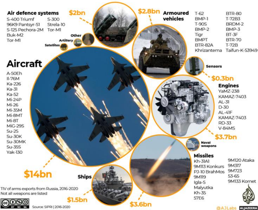
Figura 5. Junto a los hidrocarburos, el grano y los minerales, el material bélico es una de las principales exportaciones rusas al mundo. Entre 2016 y 2020, Moscú exportó 28.000 millones de dólares en armas

Half of Russia's arms exports are aircraft. Many Russian weapons are upgrades to its Soviet-era arsenal but it is developing more advanced systems . Between 2016 and 2020, Moscow sold $28bn of weapons to 45 countries.