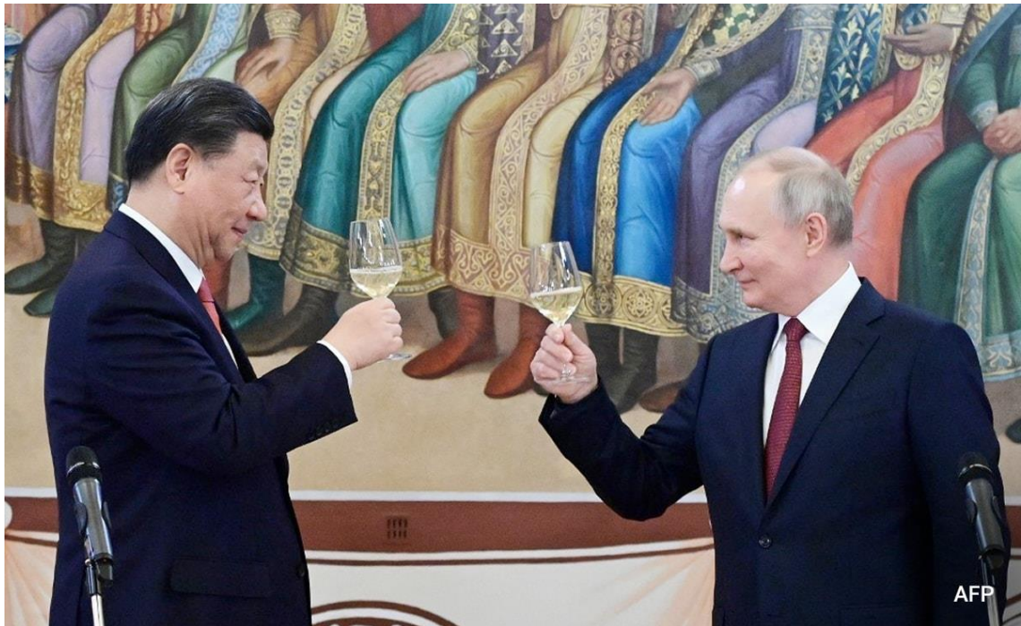
Figura 1. Xi Jinping y Vladímir Putin brindando el pasado 21 de marzo

21 de marzo de 2023. En el Salón de San Jorge del Kremlin, Vladímir Putin recibe a quien, a día de hoy, parece ser su único amigo influyente en el mundo. Con más de cuarenta encuentros personales entre ambos desde 2012, esta es la novena visita a Rusia del líder chino. En un ambiente distendido, los jefes de Estado firman diversos acuerdos en materia comercial y de seguridad, avanzando así en su hoja de ruta cooperativa. En su último encuentro, hace apenas un año, ambos afirmaron que su amistad no conocía límites 1 .