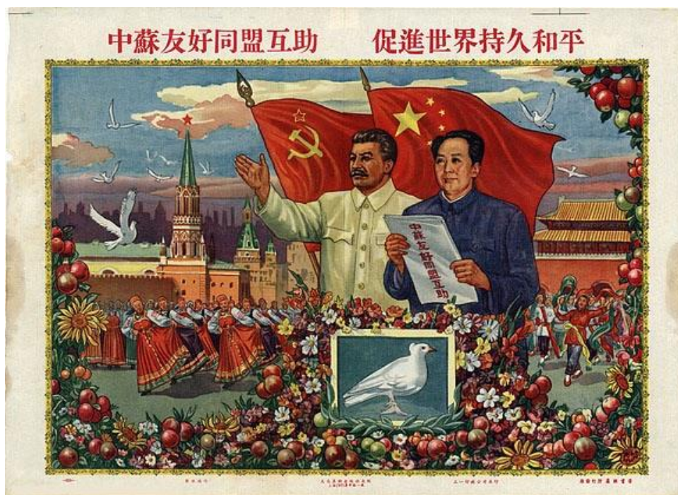
Figura 3. «La amistad y la concordia sino-soviéticas traerán la paz al mundo», póster propagandístico chino de principios de los cincuenta

El romance no duraría. Tras el fallecimiento de Stalin (1953), el nuevo Gobierno soviético se desmarcó de sus posturas más radicales, abogando por una política de distensión con Occidente contraria a los deseos de Mao. De manera gradual, la desconfianza entre ambos gobiernos fue en aumento hasta la ruptura oficial de relaciones (1961) 42 . De ahí en adelante, los contactos se limitaron al intercambio de acusaciones, con Moscú tildando al PCC de irracional y temerario y con Pekín tachando a las autoridades soviéticas de revisionistas e imperialistas.