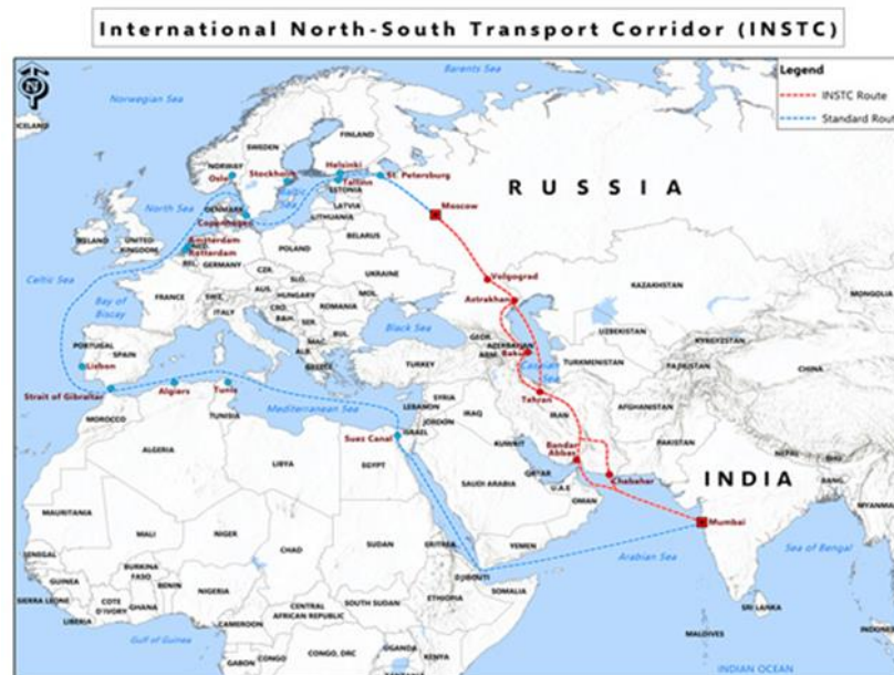
Figura 4. Mapa que muestra la ruta del INSTC que va desde San Petersburgo hasta Chababar, así como se muestra la ruta del mar Báltico. Fuente: Institute for Security and Development Policy . Consultado el 13 de septiembre de 2023.

El INSTC ha adquirido un gran potencial recientemente, debido en buena parte al papel que la India ocupa como socio vital comercial y energético del Kremlin: en 2022, Rusia supuso para la India el 15 % de sus importaciones de carbón térmico 30 , y el 20 % de petróleo crudo 31 . A la hora de transportar mercancía en el océano Índico, el INSTC es mucho más rápido que la ruta tradicional que Rusia debía seguir para exportar a India. Y es que, desde San Petersburgo hasta la India se deben pasar numerosos cuellos de botella, como los estrechos daneses, el estrecho de Gibraltar, el canal de Suez o Bab el-Mandeb. En concreto, el corredor reduce el coste de envío de la mercancía un 30 % y acelera la llegada de mercancía un 40 % respecto a la ruta tradicional San Petersburgo-Mumbai 32 . Más allá de las posibilidades económicas y de desarrollo, el INSTC permitiría a Moscú mantener el comercio en el océano Índico sin necesidad de recurrir a estrechos marítimos bajo control de la OTAN y de la UE.