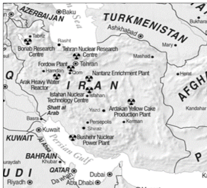
Figura 5. Diferentes reactores nucleares y plantas de enriquecimiento en Irán en 2021.

El programa nuclear iraní condiciona en buena manera las relaciones de Teherán con Occidente y es una pieza clave para entender las tensiones que Irán mantiene con Israel y Arabia Saudí. La cooperación nuclear ruso-iraní comenzó en 1995, cuando ambos países firmaron un acuerdo para que Rusia finalizase la construcción de la planta nuclear iraní de Bushehr, cuya inauguración tuvo lugar en 2010. También es relevante que Rusia haya formado a centenares de ingenieros y técnicos nucleares iraníes en su territorio.