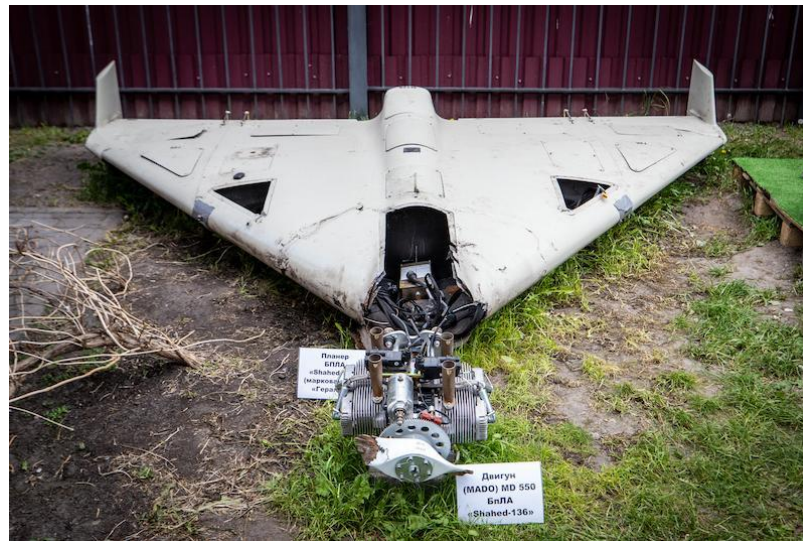
Figura 3. Restos de un dron Shahed-136, operado por Rusia como «Geran-2». Fuente: Aviation Week . Consultado el 2 de octubre de 2023.

Bajo la denominación «Geran-2», Rusia adquiere y opera grandes cantidades de este modelo y otros de la serie Shahed. A ello se le añade la constancia de que Irán envió personal militar para instruir al ejército ruso en el uso de este tipo de armamento 24 . Esta colaboración también se ha traducido en inversión extranjera directa, pues en la localidad rusa de Yelábuga se está construyendo un complejo industrial que permitirá a Rusia fabricar por sí misma este tipo de drones 25 .