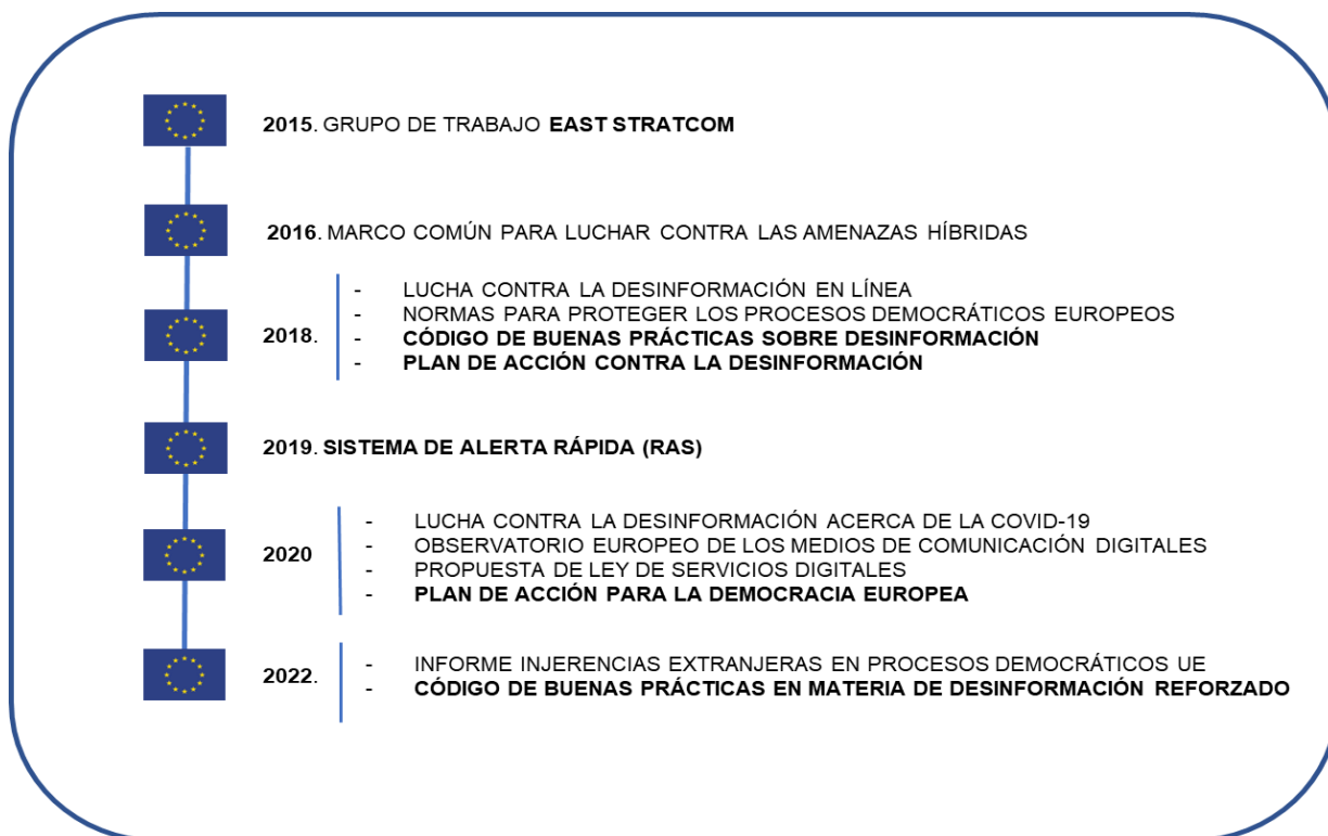
FIGURA 2. Acontecimientos de interés en la UE respecto de las amenazas híbridadas. Elaboración propia

En el ámbito nacional también se ha tomado el testigo a esta preocupación internacional. Así lo demuestra nuestra última Estrategia de Seguridad Nacional, revisada en el año 2021 (ESN21), por el que se incluyen, por primera vez, las campañas de desinformación entre los dieciséis riesgos y amenazas principales a nuestra seguridad nacional. Estas son las medidas adoptadas en los últimos años para luchar contra la desinformación: