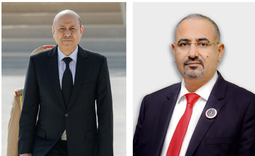
Figura 3. Rashad Al-Alimi, presidente de Yemen y jefe el Consejo de Defensa Nacional, (izda.) y Aidarous al-Zubaidi, líder del Consejo de Transición del Sur.

determinó el ingreso de las milicias huzíes en la lista de grupos terroristas de Yemen por primera vez desde el comienzo del conflicto.