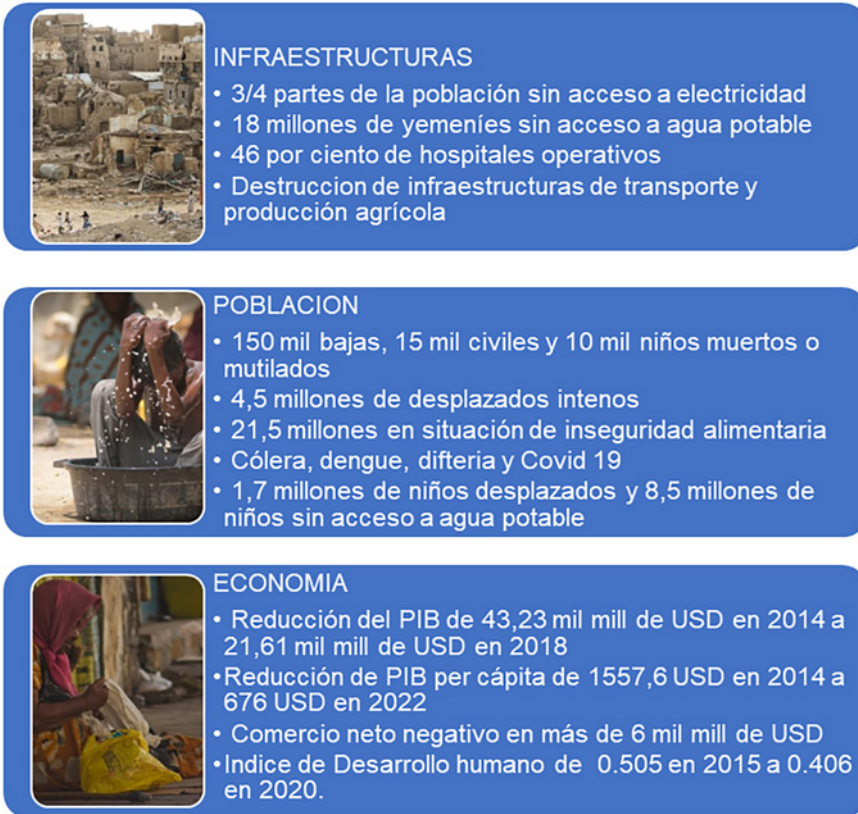
Figura 5. El impacto de la guerra