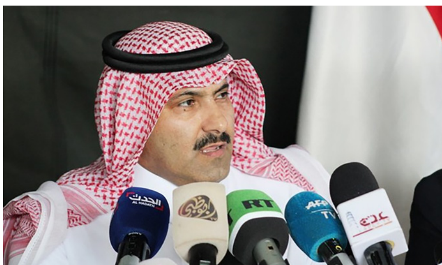
Figura 7. Mohammed Al-Jaber, principal actor regional en las conversaciones con los hutis.

En la supervisión de las políticas relacionadas con Yemen, además del príncipe heredero Muhammad bin Salmán y el príncipe Khalid bin Salman, ministro de Defensa desde septiembre de 2022, el funcionario saudí más importante en la toma de decisiones es Mohammed al-Jaber, embajador en Yemen. Hay que destacar que las primeras negociaciones directas de alto nivel entre Arabia Saudí y las autoridades huzíes tuvieron lugar durante el pasado mes de abril en Saná. Tras ellas, el 17 de junio tuvo lugar el primer vuelo comercial desde el aeropuerto de Saná hasta Yeda.