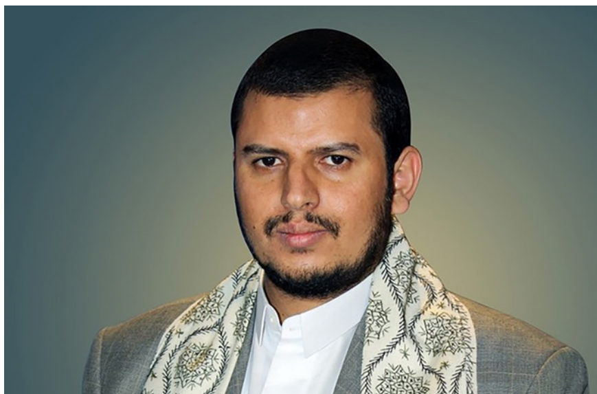
Figura 2. Abdul Malik al -Huti

En realidad, los huzíes representan una corriente revivalista y nacionalista del imamato zaidí 7 . En efecto, en el territorio bajo su mando su estrategia religiosa reposa sobre la recuperación del zaidismo, giro que llevó a cabo la familia al-Hutí, a la que también pertenece su actual líder, Abdul Malik (International Crisis Group, 2022).