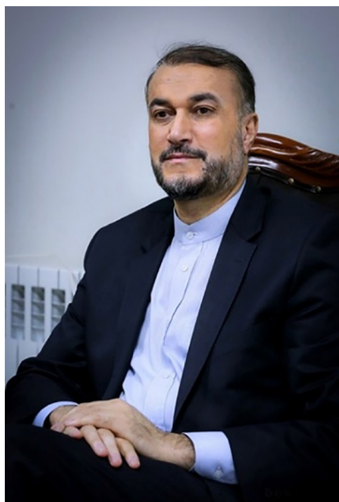
Figura. 6. Gran presencia en las negociaciones de Hossein Amirabdollahian, ministro iraní de Relaciones Exteriores

Por último, en Teherán (Irán), el 19 de junio los ministros de Asuntos Exteriores saudí e iraní, Faisal bin Farhan y Hossein Amir-Abdollahian respectivamente, conversaron sobre Yemen y las posibles relaciones comerciales e inversiones conjuntas.